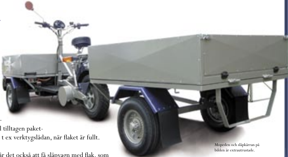
Mopeden och släpkärran på bilden är extrautrustade.

Som extrautrustning går det också att få släpvagn med flak, som i stort sett dubblar lastkapaciteten när det behövs.