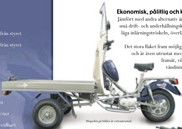
Mopeden på bilden är extrautrustad.

Över 50 års långlivad succé På Norsjö Moped AB har vi över 50 års erfarenhet av att tillverka flakmopeder av högsta kvalitet. Vi har tagit allt det bästa av vårt förflutna och låtit dåtid möta nutid, när vi nu har omdesignat vår världssuccé Norsjö Carrier, som idag finns i modellerna 4-stroke och Electronic.