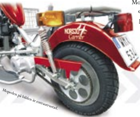
Mopeden på bilden är extrautrustad.

Modellen har nu även el-start samt katalysator, vilket ger nästan obefintliga avgaser. Norsjö Carrier 4-stroke är valet för dem i behov av en kraftfull arbetshäst för bruk såväl utomhus som i öppna lokaler.